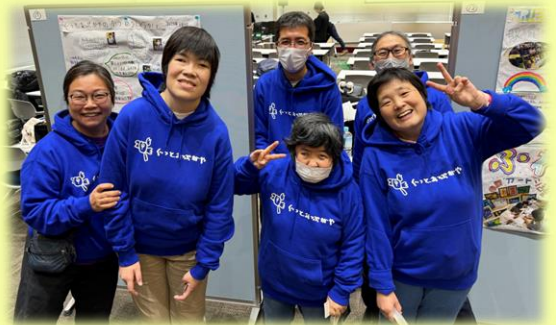
ぐっとあっぷがヤの皆さん

最近では、将来の暮らしや、渋谷区での障害のある人の暮らしについて調べ、分かったことを学会や大学の授業、渋谷区内のイベントなどで発表する活動をしています。いろんな人の話を聞いたり、自分たちの意見を聞いてもらったりするのが楽しいし、大事だと思っています。